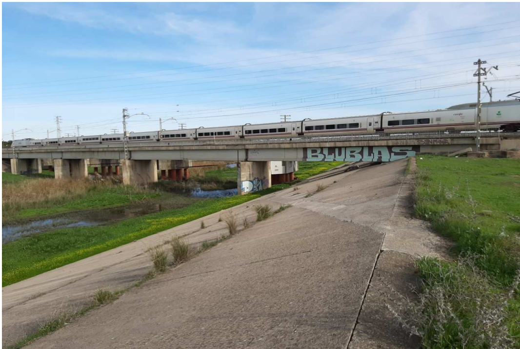
Paso de la Vía del Tren de Sevilla-Cádiz