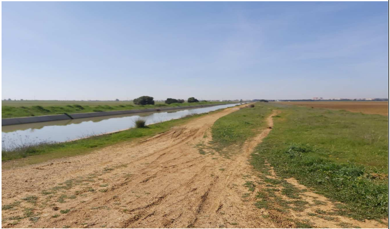
Zonas de servidumbre de paso anejas al Canal del Bajo Guadalquivir, en la circunvalación posible del aeropuerto