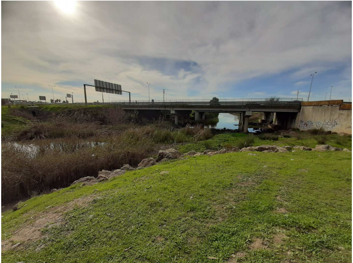
Cruce del Arroyo por la Carretera de Utrera