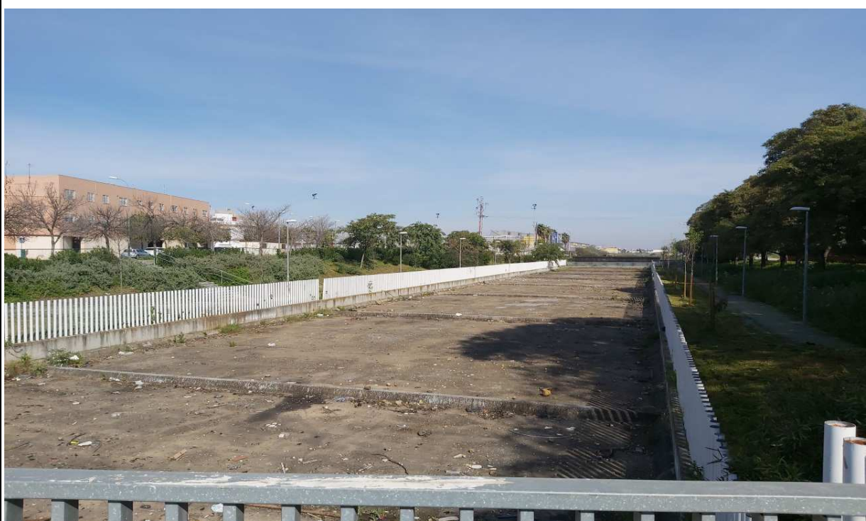
Canal de Ranillas a su paso por San José de Palmete