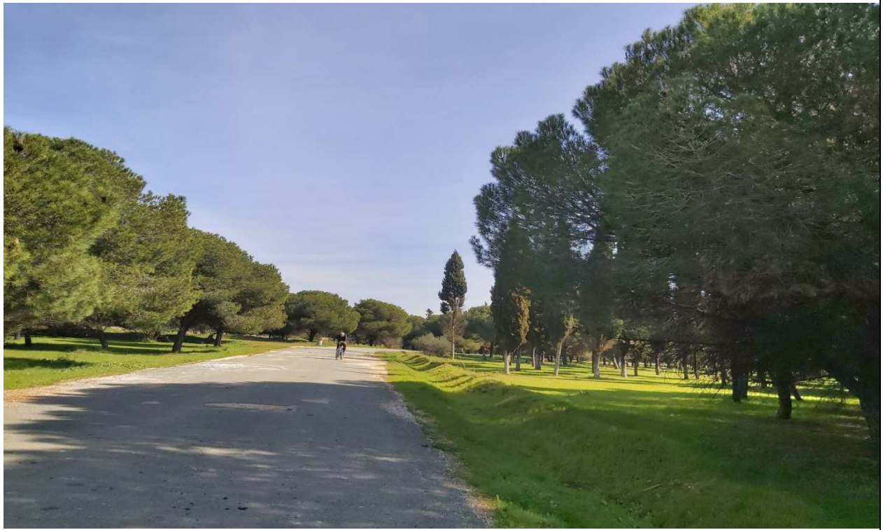
Pinares de Santa Bárbara, ya previstos como Zonas Verdes a desarrollar en el Plan General