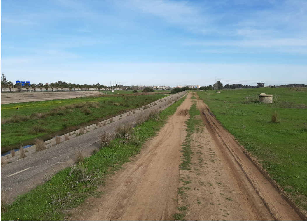
Zonas próximas al Canal susceptibles de integración