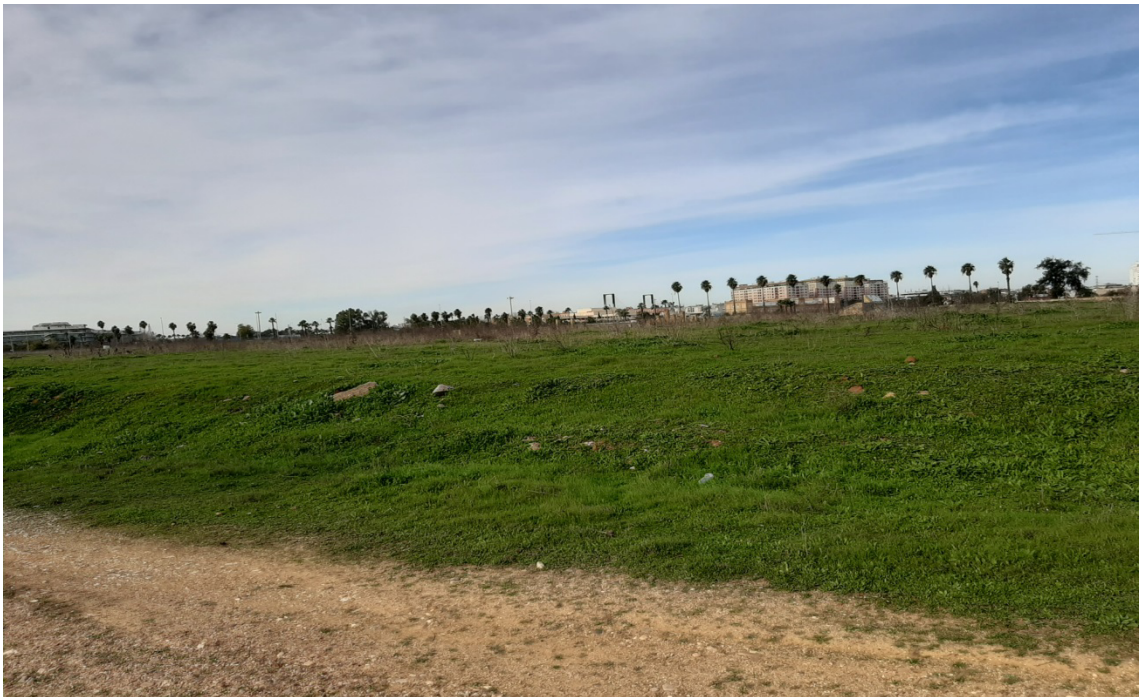
Zonas aisladas y degradadas de potencial incorporación al Anillo