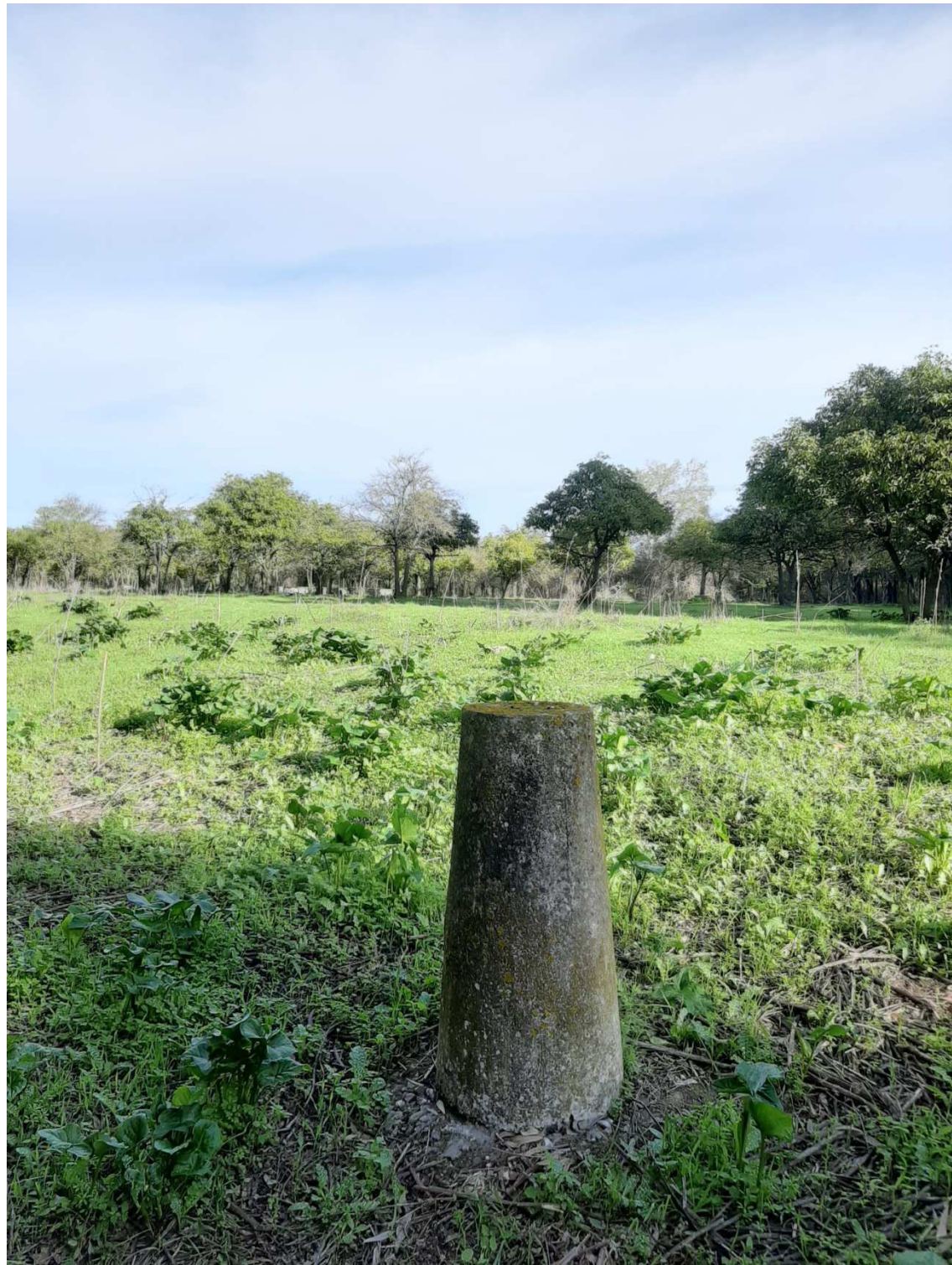
Mojones existentes del deslinde del DPH que definen zona de actuación