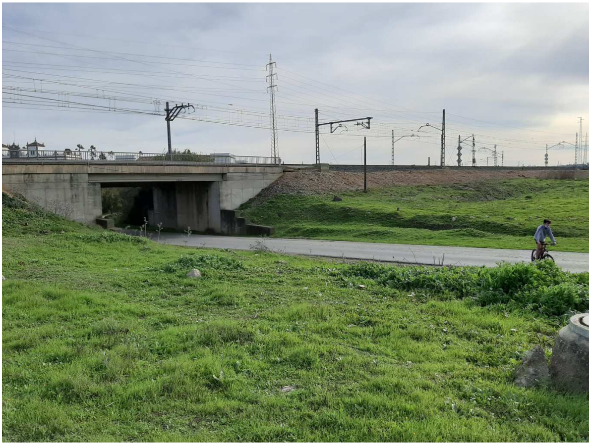
Paso soterrado de la Vía férrea a su entrada en Acuartelamiento de Pineda