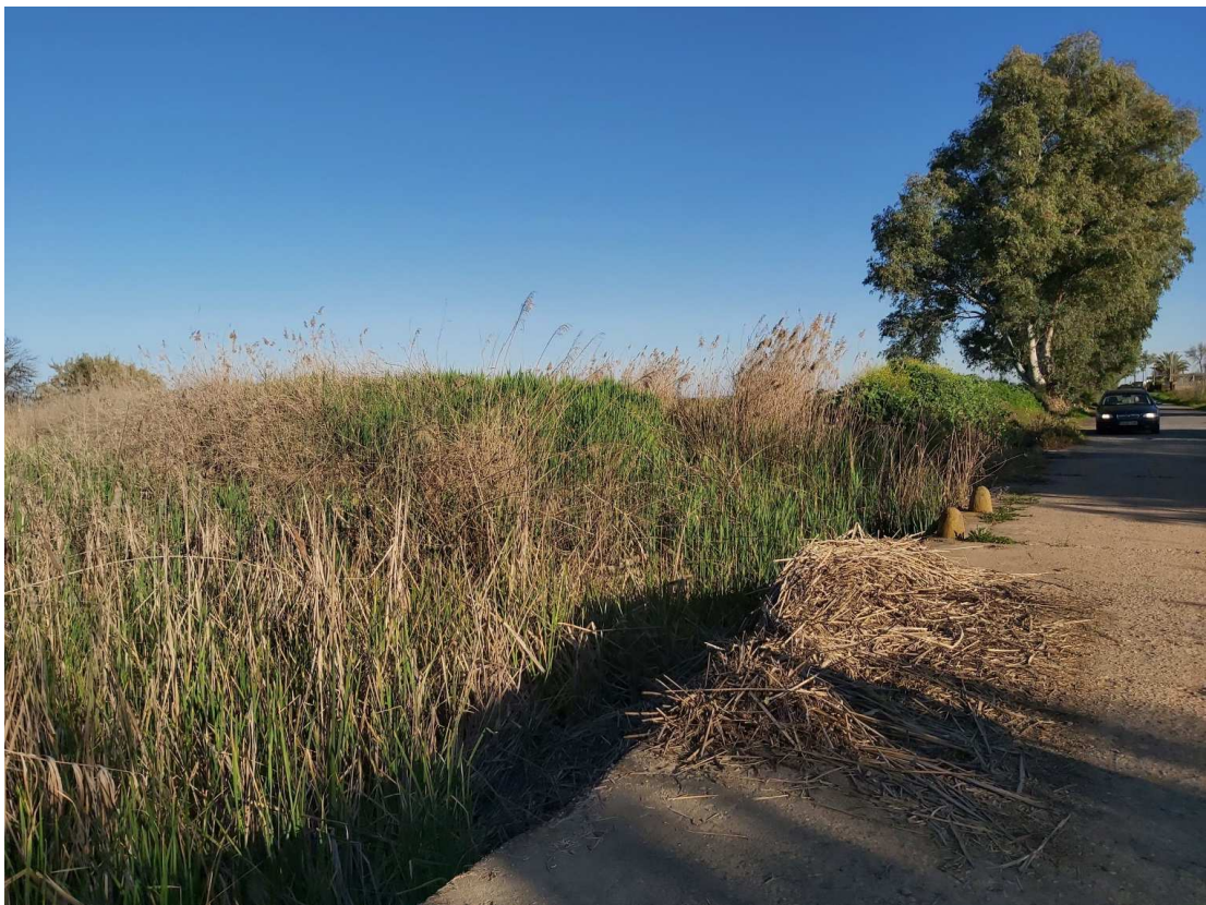
Arroyo de Miraflores en su encuentro con el Camino de los Indios