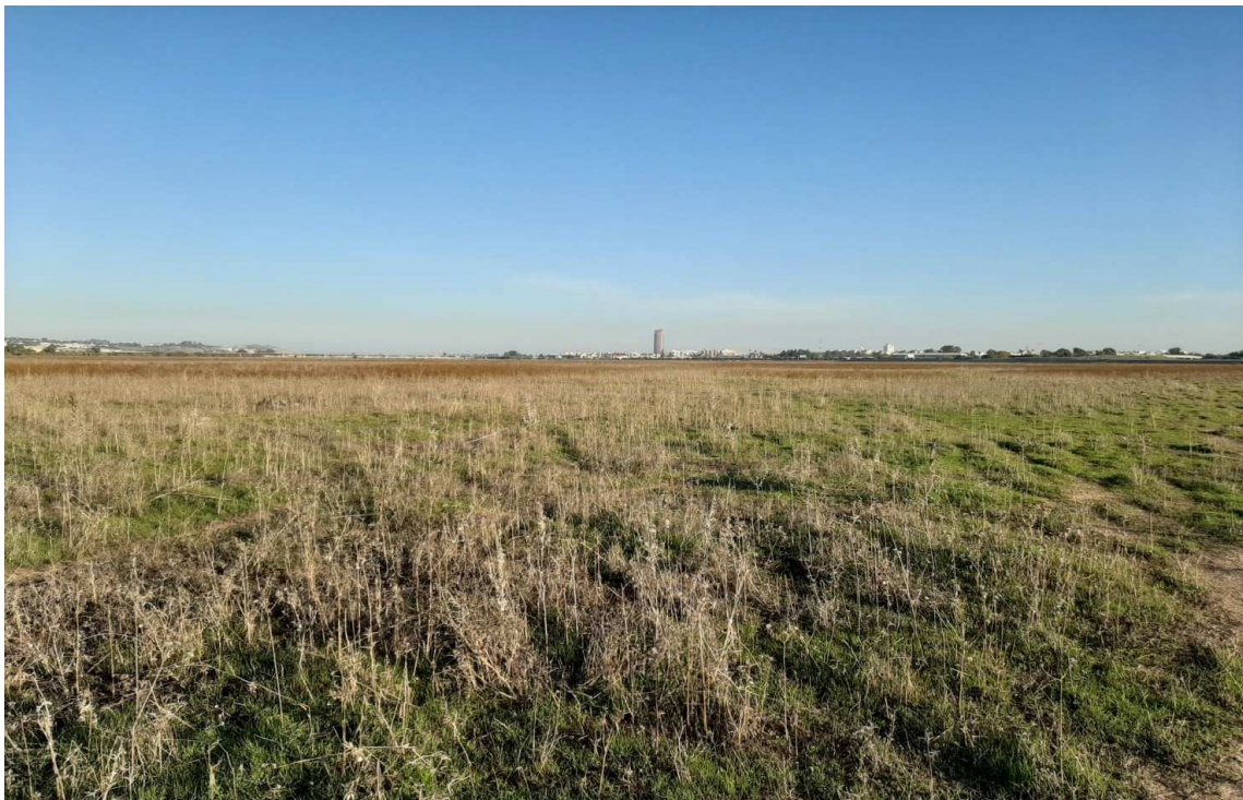
Vista general de la Vega de Tablada que linfa con el trazado propuesto