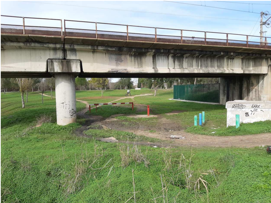
Inicio de la Fase en el paso de la vía Ferrea Junto al Río Guadaira