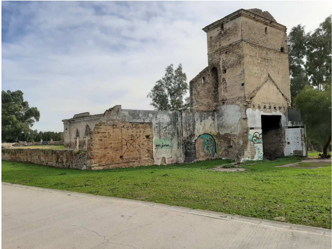
Paso junto al Molino de San Juan de los Teatinos en el Parque Guadaira 1