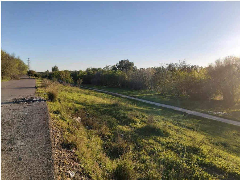
Conexión con el Inicio de la Fase I, en las proximidades al Estadio de Cartuja