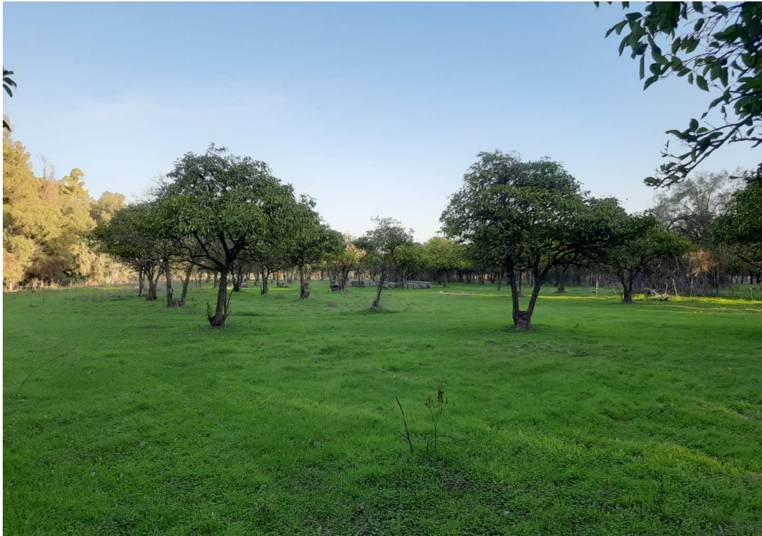
Antiguos huertos de cítricos al paso del anillo en zonas colindantes al DPH