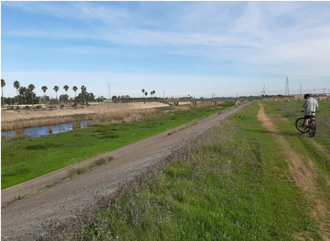
Zonas de protección del Canal del Nuevo Cauce del Río Guadaira