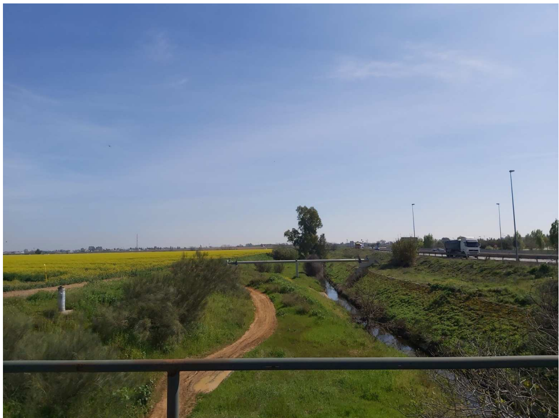
Cauce del Arroyo de San Jerónimo en zona norte