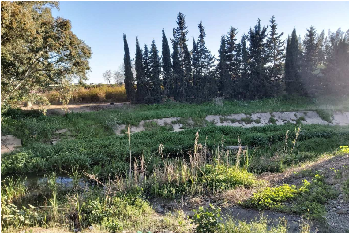
Arroyo de Miraflores en las proximidades de Valdezorras, a su paso por los Viveros de la Diputación