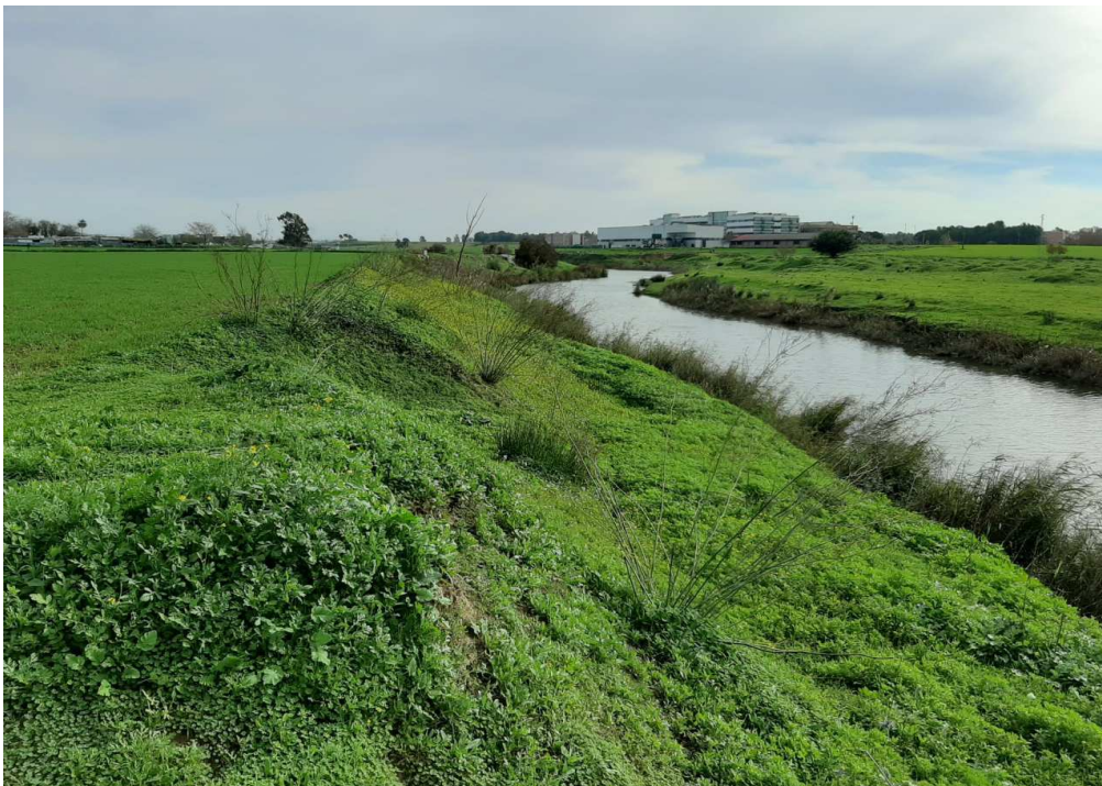
Zonas colindantes con el Río Guadaira que precisan deslinde del dominio público