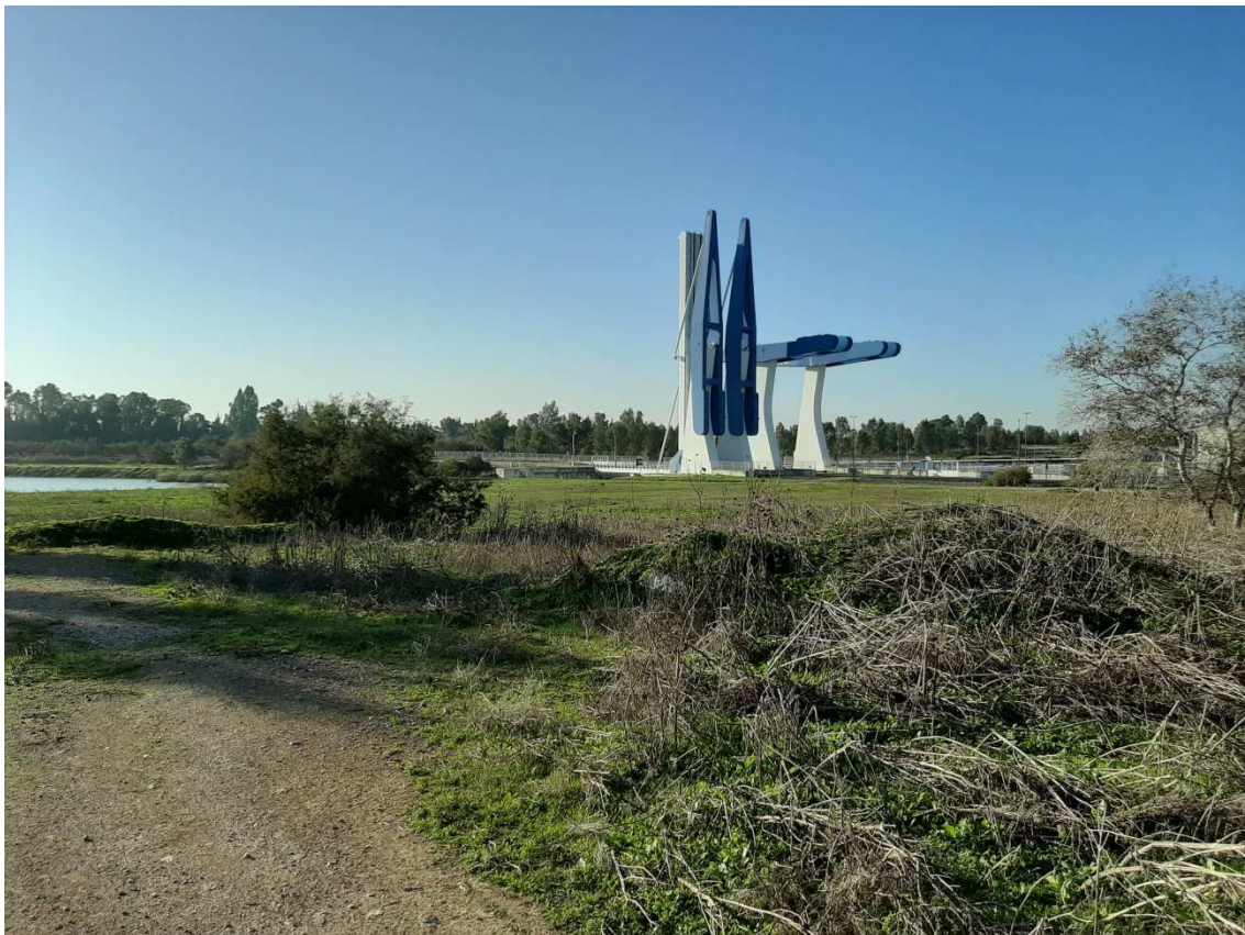
Punto de paso del Anillo Verde en la esclusa del Puerto