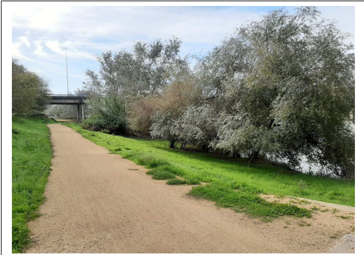
Vía verde ya existente paralela al río en buena parte del trazado