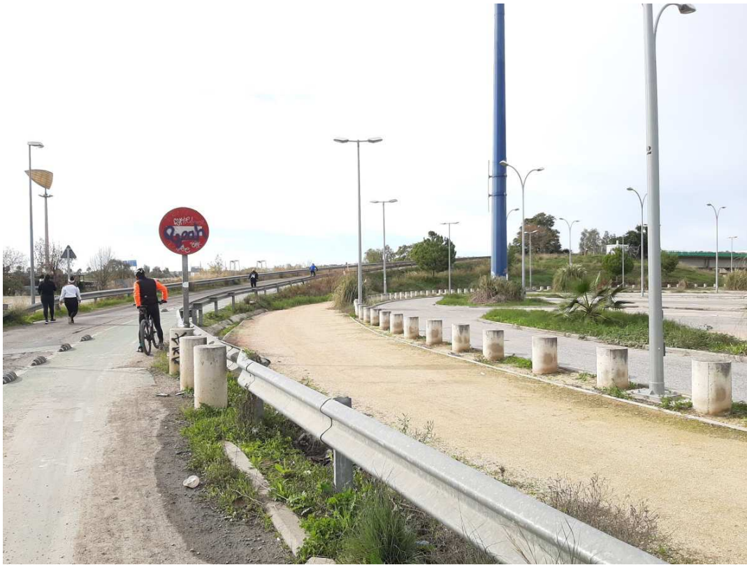
Conexión ya establecida con vías verdes del Aljarafe