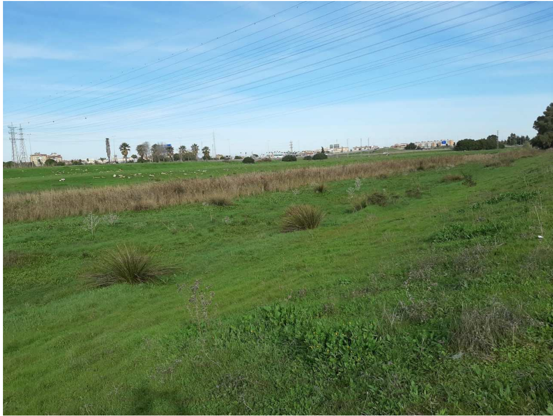
Zonas del Canal sin revestimientos hormigonados y potencialmente integrables