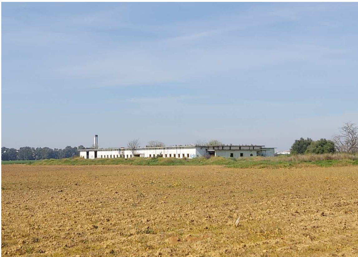
Instalaciones con aparente estado de abandono en el antiguo complejo hospitalario de San Pablo.