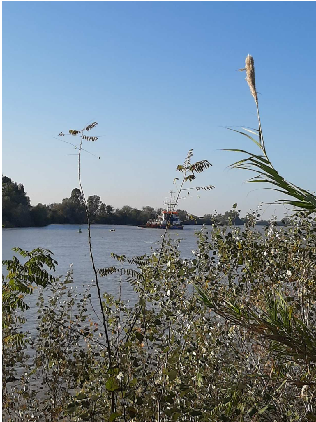
Unión de la dársena con el río Guadalquivir