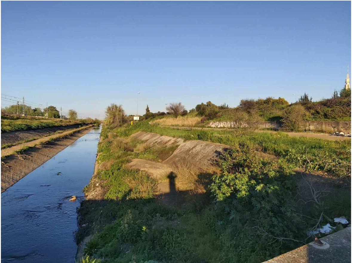
Arroyo del Tamarguillo en proximidades a Isla de Tercia