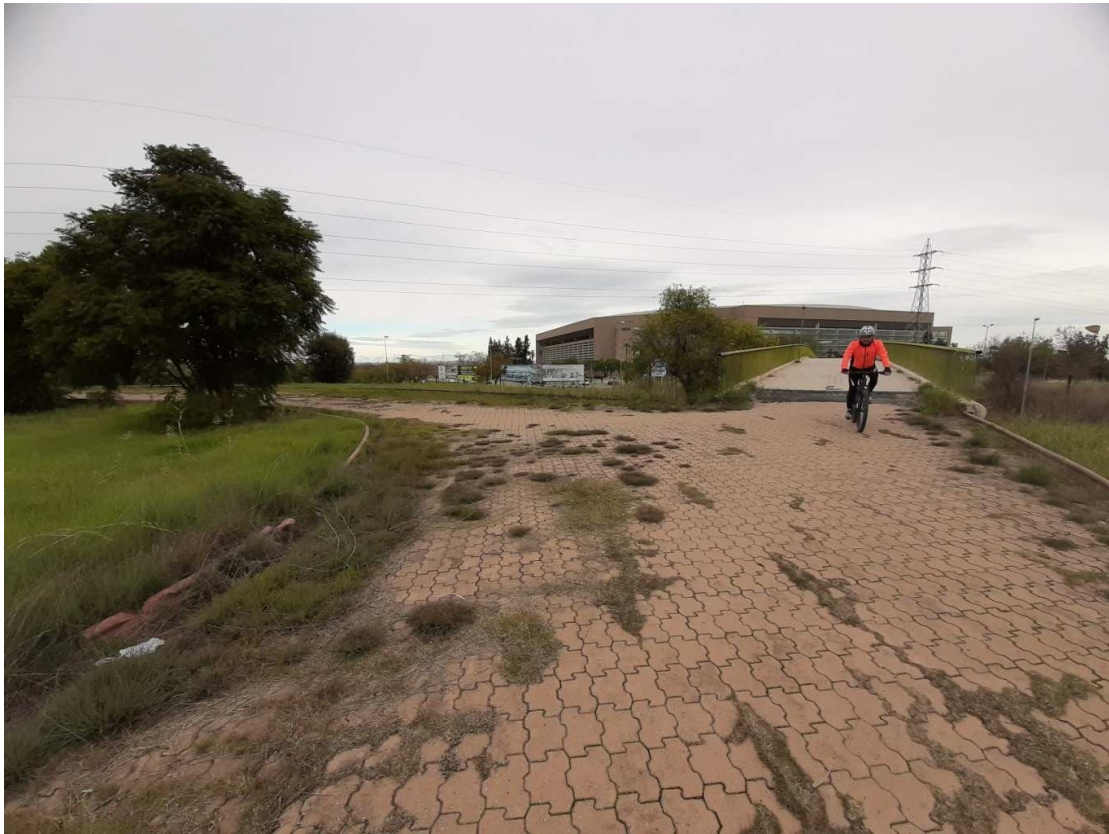
Infraestructuras de conexión con Parque del Alamillo y Parque de San Jerónimo en uso